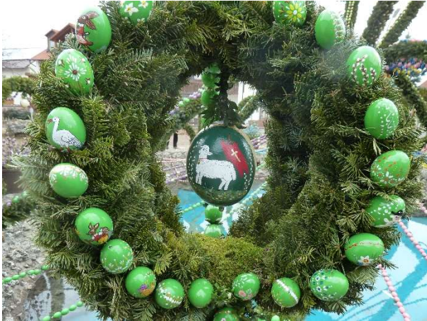
Kleiner Ausschnitt vom weltgrößten Osterbrunnen in Bieberbach / Fränkische Schweiz

Auferstehungsfeier am Ostersonntag um 06.30 Uhr in unsere Kirche Eiselthum!