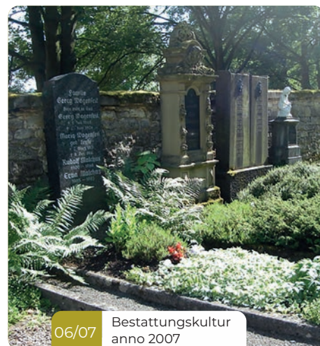
06/07 Bestattungskultur anno 2007

Friedhöfe werden mehr und mehr parkähnliche, naturbelassene Orte der Stille und Ruhe. Nicht nur die Verstorbenen sollen ihre Ruhe finden, auch für die Hinterbliebenen und Besucher soll es ein Ort des Erinnerns, der Entspannung und der Auszeit ermöglichen.