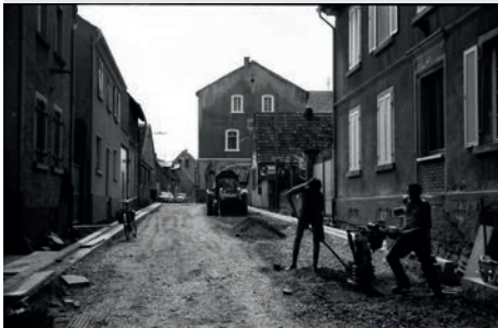
Letztmaliger Ausbau der Hauptstrasse in der 1960-er Jahren

Die Gemeinde beabsichtigt, diesen Abschnitt der Hauptstraße innerhalb der Ortslage grundhaft zu erneuern und hierdurch die Verkehrsverhältnisse für alle Verkehrsteilnehmer zu optimieren und die Verkehrssicherheit zu erhöhen. Vorgesehen ist die Umgestaltung des gesamten Straßenraumes einschließlich der bestehenden Bushaltestellen, die Umgestaltung der Knotenpunkte sowie die Herstellung von Gehwegen.