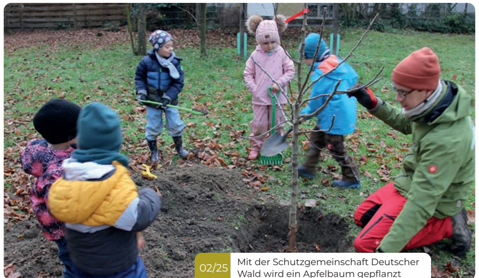
02/25 Mit der Schutzgemeinschaft Deutscher Wald wird ein Apfelbaum gepflanzt

Im Juni fand schließlich das alljährliche Spielefest im Pfarrgarten statt. Wie in den Jahren zuvor trafen sich Kinder, Eltern und Erzieher zu einem