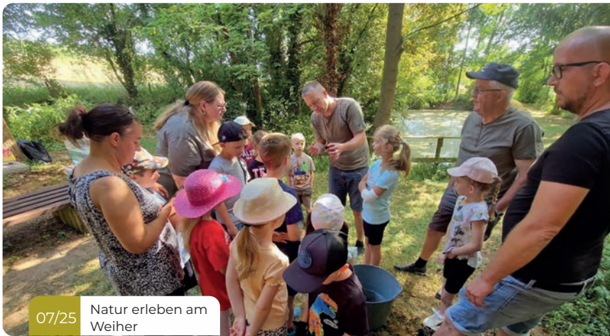
07/25 Natur erleben am Weiher