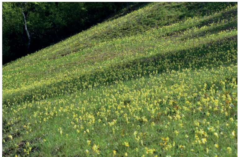
Ein gelber Teppich von Schlüsselblumen überzieht die Magerwiesenflächen