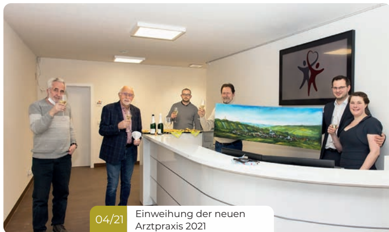
04/21 Einweihung der neuen Arztpraxis 2021

Da ab 2025 die ärztlichen Kapazitäten durch weitere Kolleginnen und Kollegen (ca. 1 Vollzeitstelle) ausgebaut werden soll und auch in 2027 weitere Kollegen geplant sind, ist ein Anbau von ca. 150 Quadratmetern erforderlich. Seitens der Gemeinde sind die Weichen, was Planung und Finanzierung betrifft gestellt, sodass die Baumaßnahme 2026 beginnen kann. In diesem Zusammenhang werden auch zusätzliche Parkplätze auf dem Nachbargrundstück entstehen.