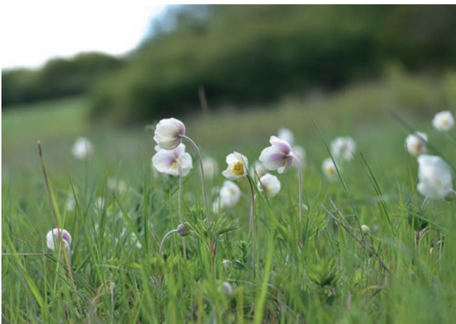
Buschwindröschen, grazile Schönheiten soweit das Auge reicht

Für seine Verdienste zum Wohle unserer Gemeinde und ihrer Bürgerinnen und Bürger wird er einen würdigen Platz in der Geschichte Albisheims einnehmen; wir werden ihm ein ehrendes Andenken bewahren.