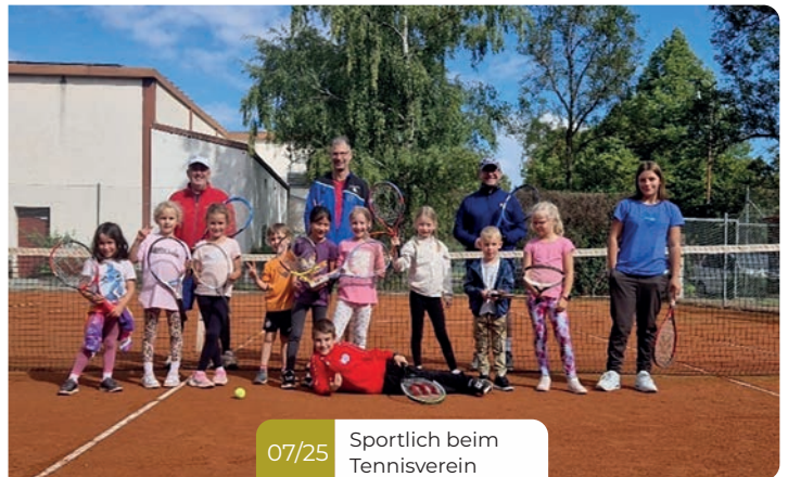
07/25 Sportlich beim Tennisverein