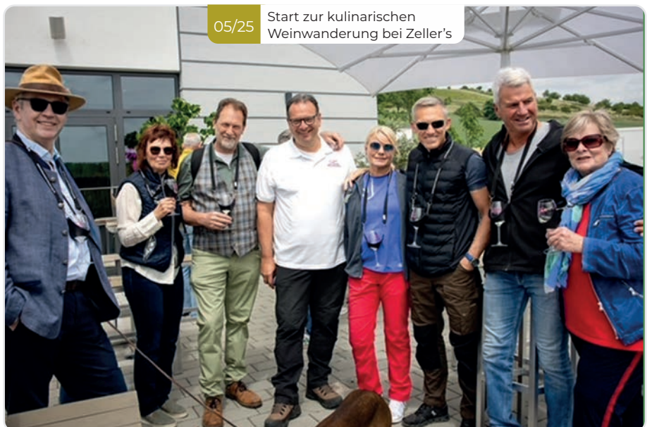
05/25 Start zur kulinarischen Weinwanderung bei Zeller's

Weingut Bescher belebte wieder am „Vatertag“ den Wartturm und zog zahlreiche Wanderfreunde an. Es ist immer wieder faszinierend, welchen wunderbaren Ausblick man bei gutem Wetter vom Albisheimer Wahrzeichen hat.