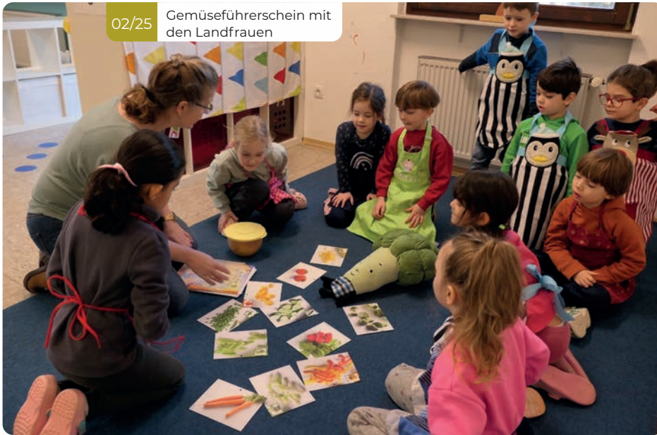
02/25 Gemüseführerschein mit den Landfrauen

Ein Jahr in der Kita vergeht oft schneller, als man denkt – besonders, wenn es so ereignisreich ist wie in der Sonnenkita. Vom ersten Tag nach den Sommerferien bis zur feierlichen Verabschiedung der Vorschulkinder war das Kita-Jahr geprägt von spannenden Projekten, kreativen Aktionen und vielen wertvollen Lernmomenten.