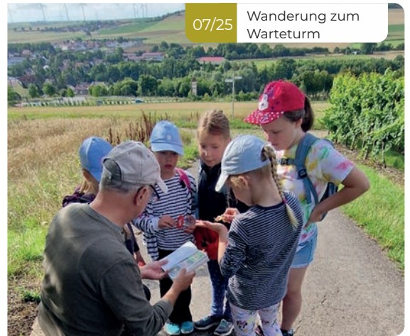
07/25 Wanderung zum Warteturm

Auch künstlerische Talente kamen nicht zu kurz: Im Rahmen einer Theatervorstellung wurde das bekannte Stück „Die Bremer Stadtmusikanten“ aufgeführt. Die Kinder schlüpften dabei selbst in die Rollen der Tiere, standen auf der Bühne und sorgten für viele Lacher beim Publikum. Kreativität, Mut und Teamgeist standen hier im Vordergrund.