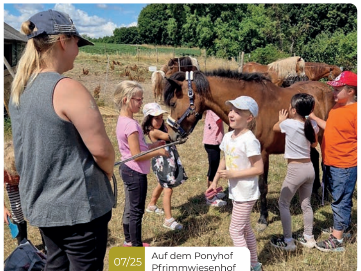
07/25 Auf dem Ponyhof Pfrimmwiesenhof