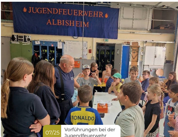
07/25 Vorführungen bei der Jugendfeuerwehr

Unter dem Motto „Natur erleben“ stand auch der vierte Programmpunkt: eine Kinderwanderung rund um den Warteturm. Mit Lupenbechern ausgestattet machten sich die kleinen Entdecker auf den Weg und erkundeten Pflanzen, Insekten und ihre Umgebung. Bei strahlendem Wetter wurde spielerisch viel über die heimische Flora und Fauna gelernt.