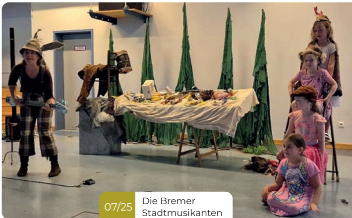
07/25 Die Bremer Stadtmusikanten

Das Sommerprogramm 2025 in Albisheim war erneut ein voller Erfolg. Es zeigte eindrucksvoll, wie vielfältig Lernen sein kann – ob in Gummistiefeln auf dem Bauernhof, mit einer Angel an der Pfrimm oder mit Theaterkostüm auf der Bühne. Ein herzlicher Dank geht an alle Vereine, Helferinnen und Helfer, die dieses abwechslungsreiche Programm möglich gemacht haben!